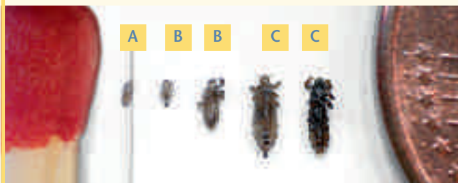
Для сравнения: спичка / 1-центовая монета

... проходит различные стадии от яйца через стадию личинки до взрослой, половозрелой особи. Яйца, хитиновые оболочки которых также называют гнидами (А), откладываются самкой у кожи головы и приклеиваются к волосам водостойким веществом. Через 8–10 дней после кладки из яиц вылупляются личинки (В). За 9–11 дней они превращаются во взрослые половозрелые особи (С) – и цикл начинается заново.